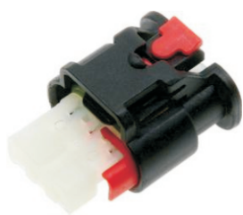
D W:19.1 H:14.7 L:26.6