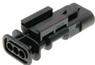
A W:18.8 H:10.8 L:44.0