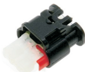
E W:19.1 H:14.7 L:26.6