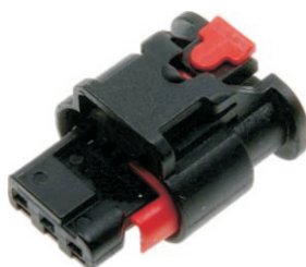
B W:19.1 H:14.7 L:26.6